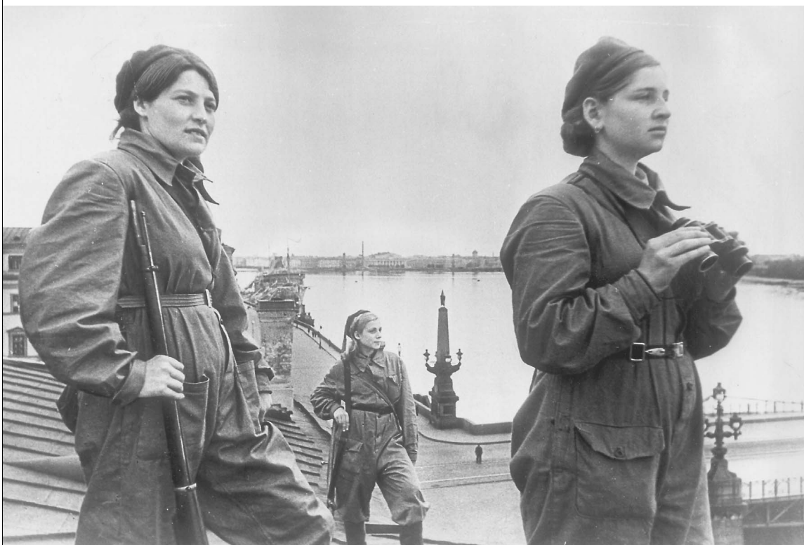
Ленинград, 1943 год. Девушки — бойцы ПВО спасли город от разрушения, но дом, где жил будущий знаменитый шахматист, не уберегли