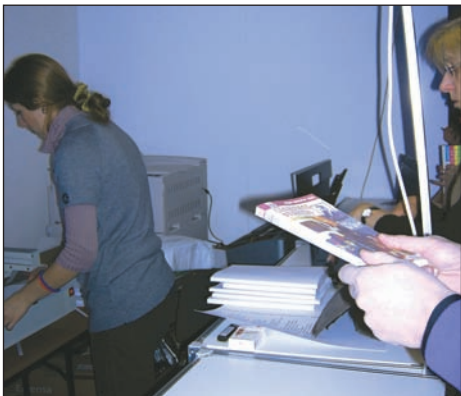
Принт-он-деманд в действии