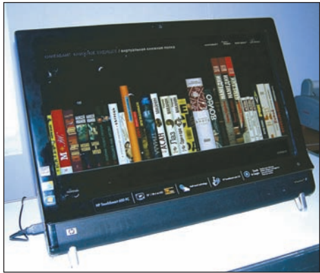
Виртуальная книжная полка