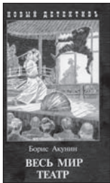
Акунин Б. Весь мир театр. М.: Захаров, 2010. — 432 с.

4 Долго ждали читатели нового романа из «фандоринской» серии. Действие книги Бориса Акунина «Весь мир театр» происходит в 1911 году. Эраст Фандорин расследует преступления, совершенные в одном из московских театров. Эрасту Петровичу уже около пятидесяти лет, но он по-прежнему бодр как духом, так и телом — сказывается японская подготовка.