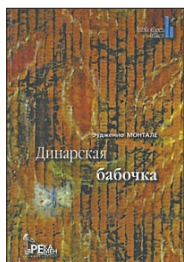
Монтале Э. Динарская бабочка / Пер. с ит. Е.Солоновича. М.: Река времен, 2010. — 248 с. — (Bibliotheca Italica).

7 На русском языке впервые выходит кolumнистика одного из крупнейших итальянских поэтов XX века, лауреата Нобелевской премии 1975 года. Это «проза поэта» в лучшем смысле слова. Воспоминания детства, пейзажные и бытовые зарисовки, философские и музыкальные рефлексии — все это позволяет понять, из «какого сора» растут тонкие аллюзии и изысканные образы его лирики.