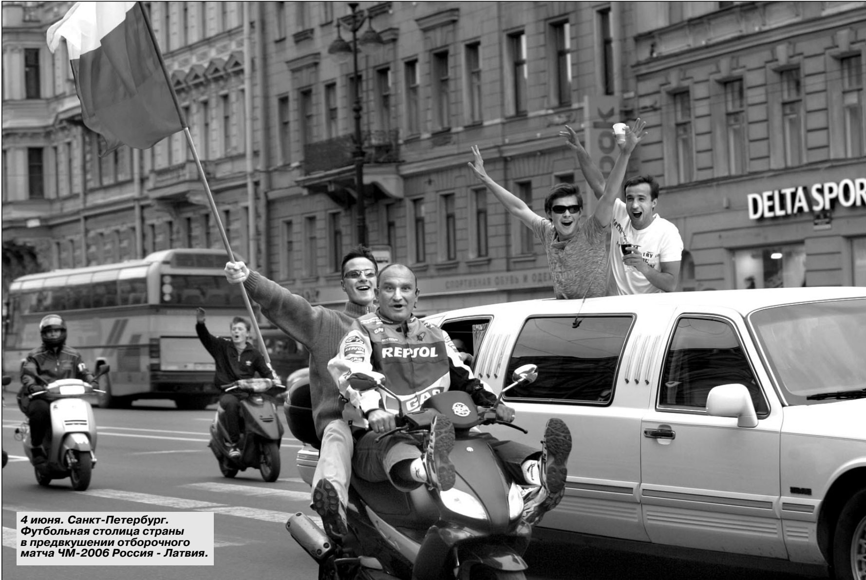
4 июня. Санкт-Петербург. Футбольная столица страны в предвкушении отборочного матча ЧМ-2006 Россия - Латвия.

Короче говоря, июньский Петербург - не только белые ночи. Это еще и Футбол. Именно так, с большой буквы. Как синоним страсти и любви - тех проявлений человеческой жизни, которые нужны всегда, но сегодня - особенно. Спасибо, Питер!