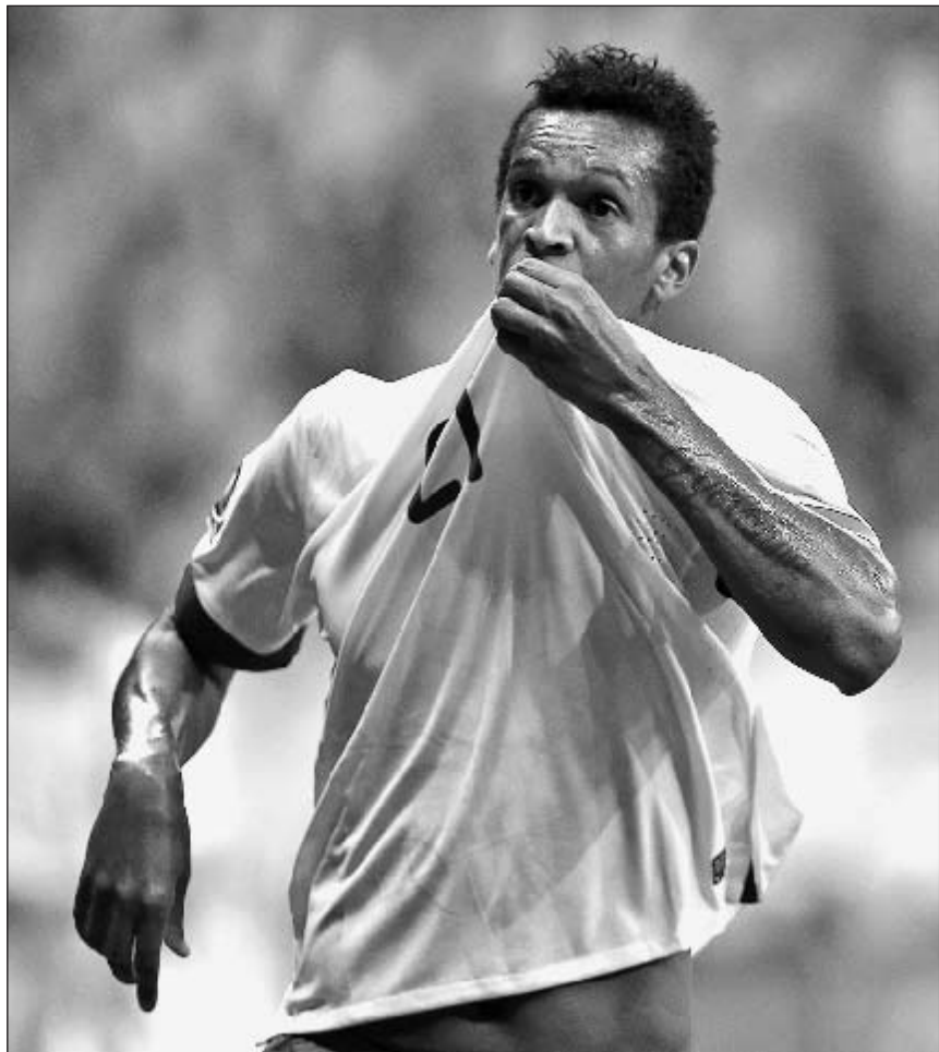
Суббота. Бразилия. Бразилия - Япония - 3:0. 90+3-я минута. Только что ЖО забил третий гол.