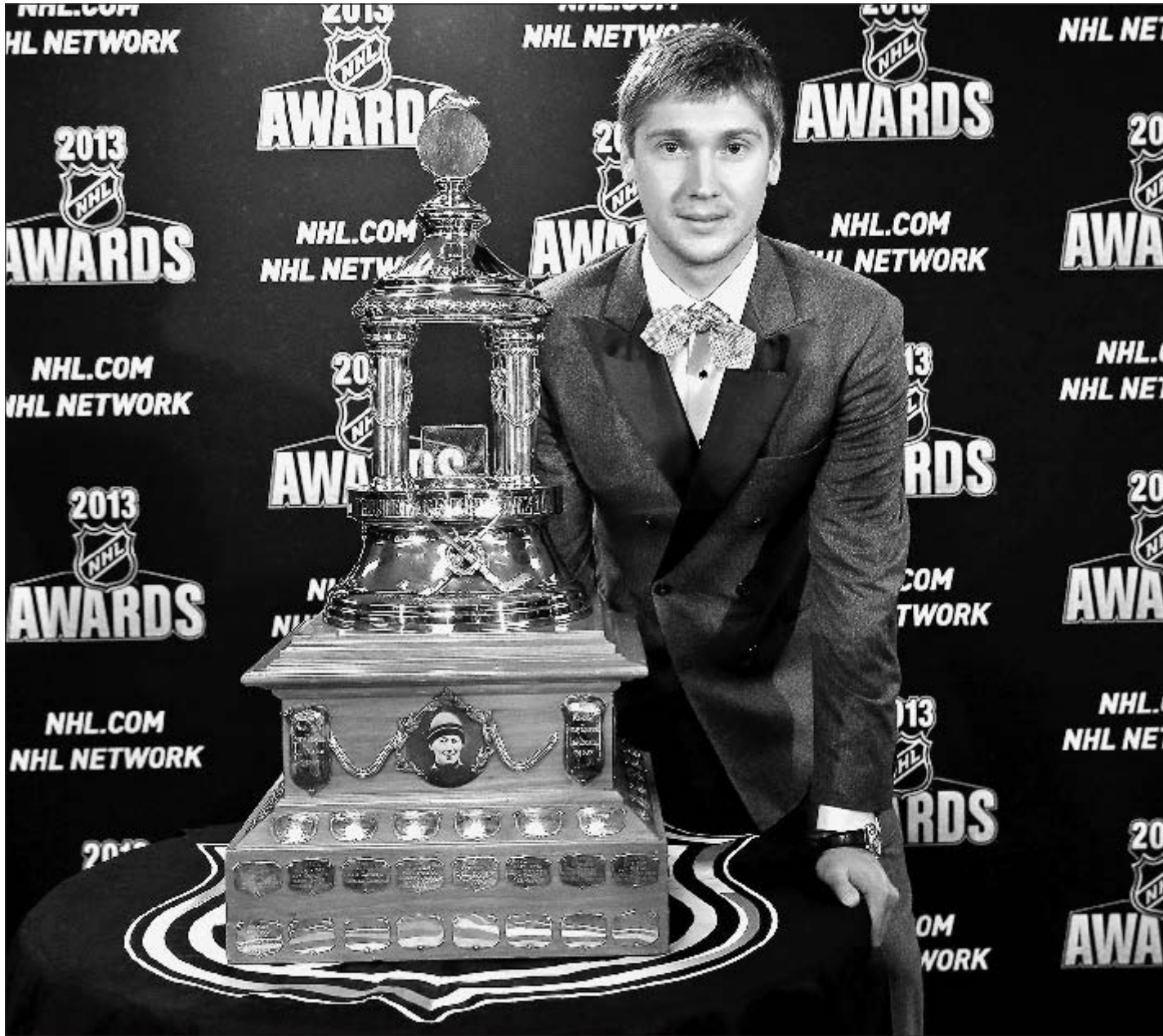
Вчера. Чикаго. Сергей БОБРОВСКИЙ и его «Везина Трофи».

В ночь с субботы на воскресенье в Чикаго состоялась церемония вручения индивидуальных призов регулярного сезона НХЛ. Впервые в истории трофеем лучшего голкипера лиги - «Везина Трофи» - завоевал российский вратарь Сергей Бобровский из «Коламбуса». Тогда как снайпер «Вашингтона» Александр Овечкин в третий раз в карьере получил приз самому ценному игроку турнира - «Харт Трофи».