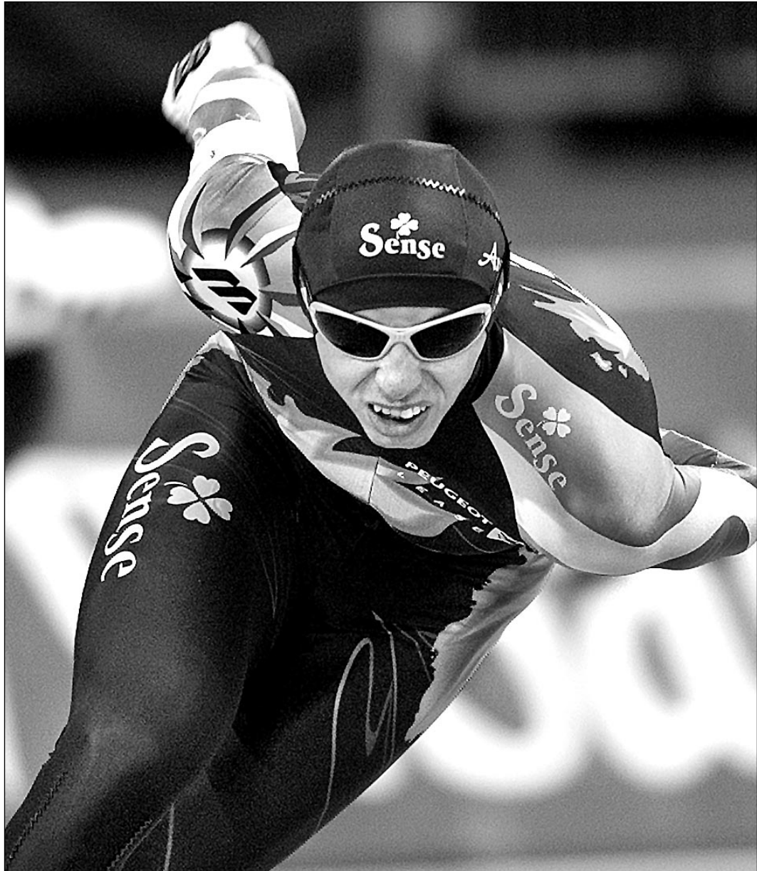
Суббота. Хамар. Победный забег Вадима САЮТИНА на дистанции 5000 м.

Вчера на льду олимпийского крытого катка в Хамаре 29-летний Вадим Саютин вернул России надежду на то, что скоростной бег на коньках, некогда национальный вид спорта, жив! Установив четыре великолепных национальных рекорда - в беге на 1500, 5000 и 10000 м и в сумме многоборья, завоевав две малые медали - золотую на «пятерке» и серебряную на «десятке», Саютин стал вице-чемпионом мира. Это лучший результат российских многоборцев за последние 11 лет. Последним нашим успехом на мировой арене была победа Николая Гуляева в Херенвене в 1987 году.