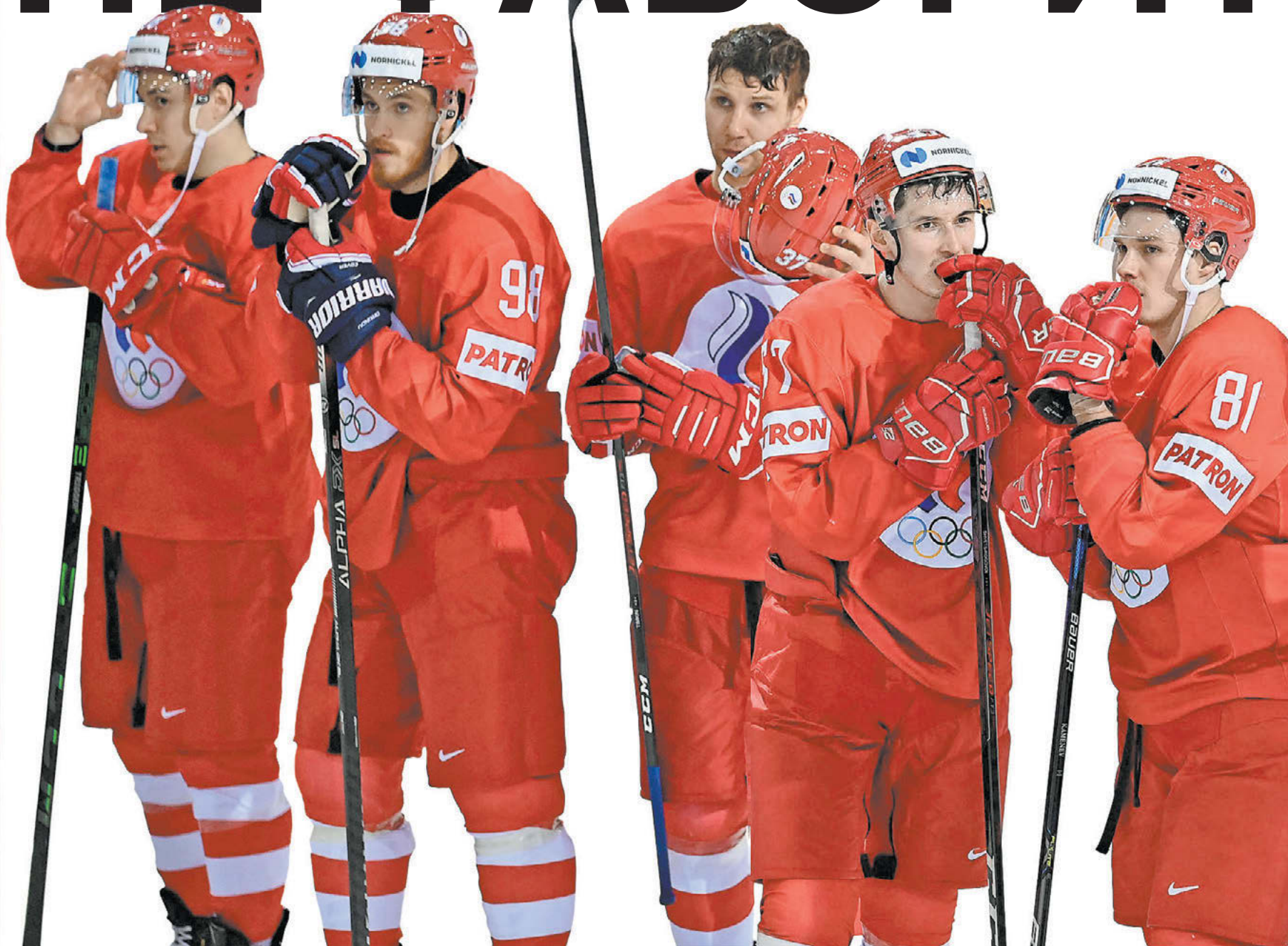
Вчера. Рига. Словакия – Россия – 3:1. Хоккеисты нашей сборной после игры

Победа над грозной (до турнира) Чехией и разгром Великобритании вкупе с провалами других фаворитов заставили ненадолго поверить, что российская сборная, несмотря на большие проблемы с составом, чуть не главный претендент на золото прямо сейчас. Канадцы и шведы вообще не набирали очки, финны уступили казахстанцам, а американцы – финнам. А тут еще и объявление о подкреплении в лице Тарасенко, Орлова и Самсонова.