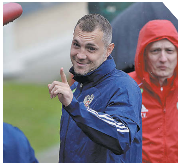
Александр Федоров «СЗ» / Canon EOS-1DX Mark II