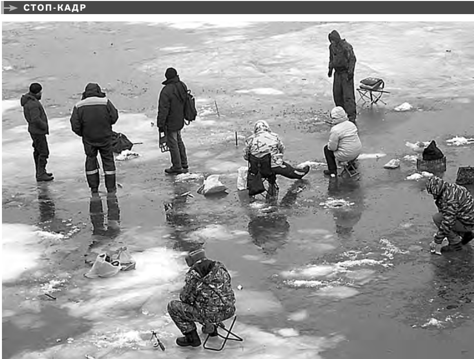
В южных регионах пошла рыба. Но и лед тоже пошел. В марте он самый опасный, и беспечные рыбаки часто проваливаются в полыньи. Сотрудники МЧС чуть ли не ежедневно выезжают к водоемам по сигналу бедствия.

СТРОИТЕЛИ фронтовой дороги Астрахань—Кизляр смогут бесплатно получить земельные участки в собственность для индивидуального жилищного строительства, а также ведения личного подсобного хозяйства, если законопроект примут депутаты. На подготовку процедуры передачи участков из средств республиканского бюджета требуется 2,5 миллиона рублей. К слову, сейчас ветеранов стройки осталось чуть больше 240 человек.