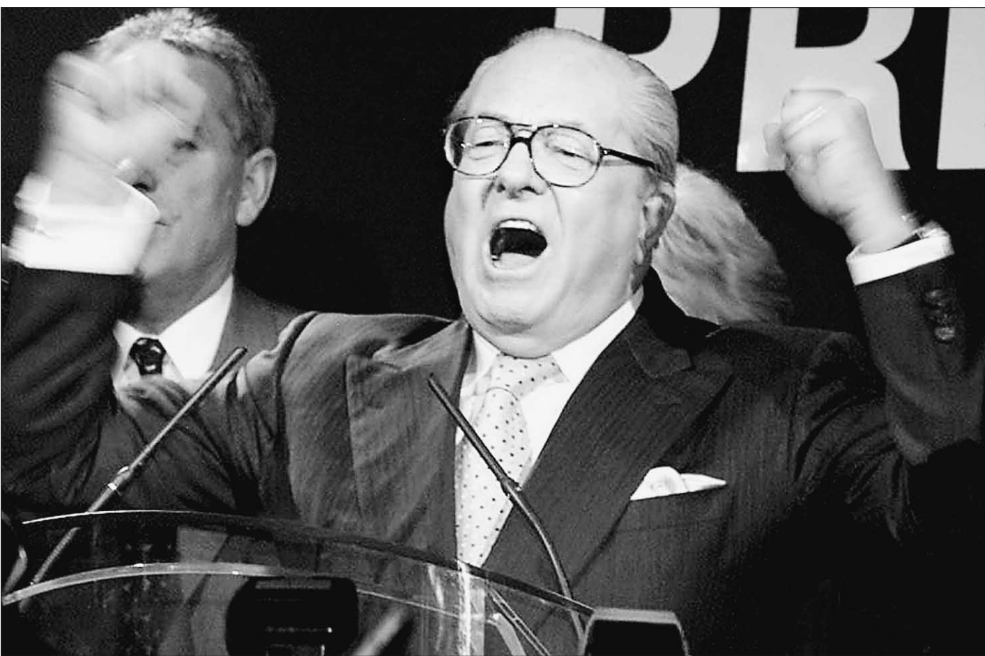
Жан-Мари Ле Пен празднует победу

Франция была вне подозрений. Франция гордилась (а порой и кичилась) своей левой интеллектуальной элитой, своей почти образцовой политкорректностью, своей бескомпромиссной прессой, неустанно борющейся за со-