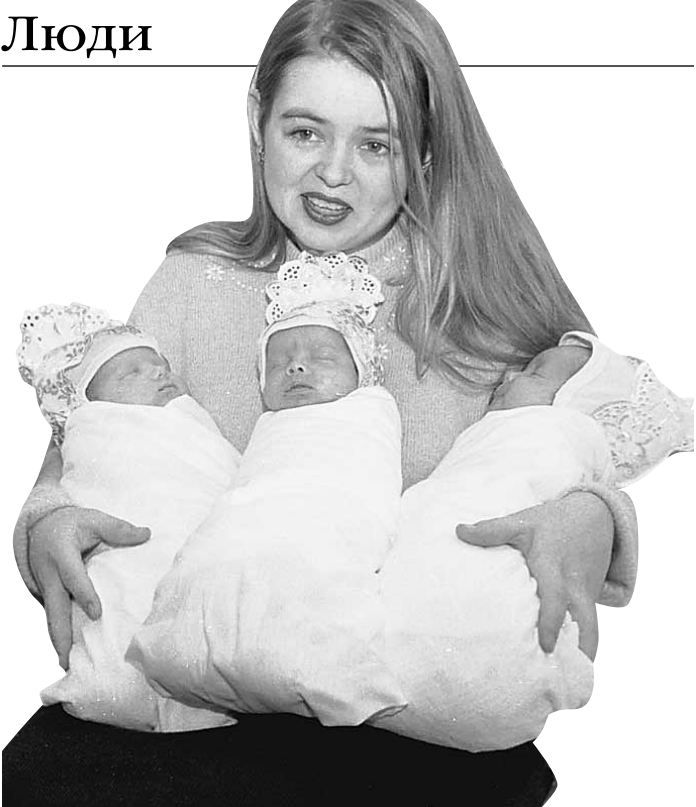
Иркутянок обяжут рожать 3