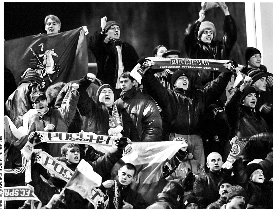
Открытие футбольного сезона в России игроки «Локомотива» превратили для многочисленных болельщиков в настоящий праздник.

Счет 1:0 не устраивал никого из соперников. Команда Семина желала создать солидный задел перед игрой в Хайфе, а израильтяне надеялись забить гол на выезде. Но