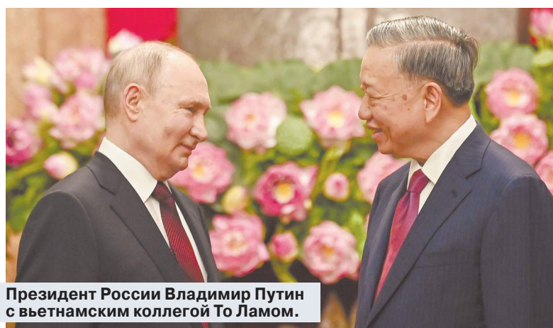
Президент России Владимир Путин с вьетнамским коллегой То Ламом.