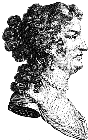
MADAME DE MAINTENON.