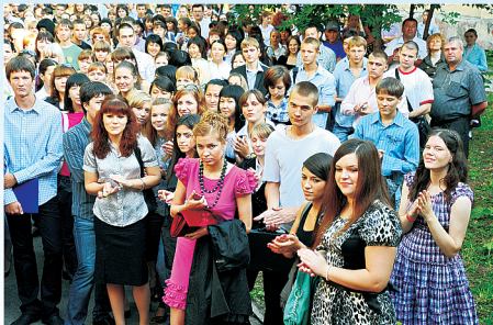
День знаний, 2010 г.

2010 г. «Я решила поступить в Медакадемию. Учиться вначале тяжело, но я думаю, будущее того стоит! И мы не из робкого десятка, чтобы при первой трудности опускать руки...» (Из интервью с первокурсниками. Медик Кузбасса, ноябрь 2010 г.)