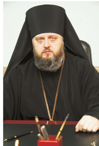
С уважением, Епископ Кемеровский и Новокузнецкий