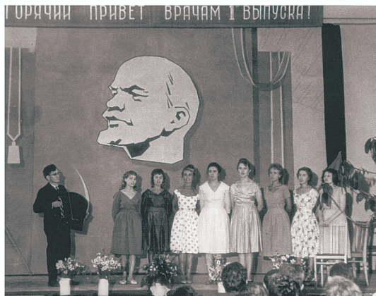
Хор 1958 года