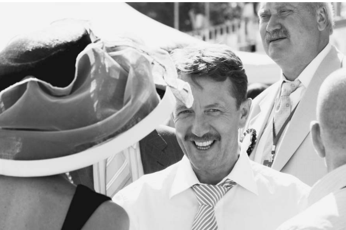
Виды министра на урожай ПЕРЕМЕНЧИВЫ, как женская мода

Лихие казачьи пляски, хоровод девушек с колосьями на голове, протяжное «Каким ты был, таким остался», а в качестве кульминации плодотворный Филипп Киркоров, благословивший жатву. Такой ударной программой в минувшую пятницу Кубань отмечала День урожая. Главы Минсельхоза и Краснодарского края «низко кланялись всем хлебоборобам», ликовали по поводу небывалого урожая, уверяли, что «Кубань поразила весь мир», который «этим летом остался без зерна». Тем временем в самой России хлеб и дальше будет дорожать. И это чиновники считают нормальным. → стр. 3