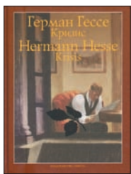
Гессе Г. Кризис / Пер. с нем. Е.Соколовой, С. Апта, О.Волковой; Подготовка текста и послесловие Е.Соколовой. М.: Текст, 2010. — 173(3) с.

5 Цикл «Кризис» Герман Гессе писал одновременно со «Степным волком» — писатель даже называл роман «продолжением ночных стихов». Сначала Гессе хотел «подарить» некоторые из этих стихотворений Гарри Галлеру, но потом все-таки передумал и издал под своим именем. На русском языке «Кризис» выходит впервые.