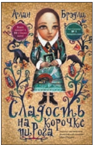
Брудли А. Сладость на корочке пирога / Пер. с англ. С.Абовской. М.: АСТ: Астрель, 2010. — 416 с.

4 В старинном английском поместье обитают последние представители аристократического рода — эксцентричный полковник де Люс и три его дочери. Летом 1950 года тягучее болото сельской жизни нарушают невероятные события: убийство незнакомца и арест полковника. Пока старшие дочери рыдают в платочки, младшая, одиннадцатилетняя Флавия, приступает к поискам.