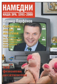
Парфенов Л. Намедни. Наша эра. 1991-2000. М.: Издательская группа Аттикус, 2010. — 304 с.

7 Экскурс Леонида Парфенова по советско-российскому универсуму ушедшего века завершает том о 90-х — годах, для кого-то лихих в плохом, для кого-то — очень даже в хорошем смысле этого слова. Для одних они стали концом света, для других — зарей нового мира. И сделали сильнее всех, кого не убили...