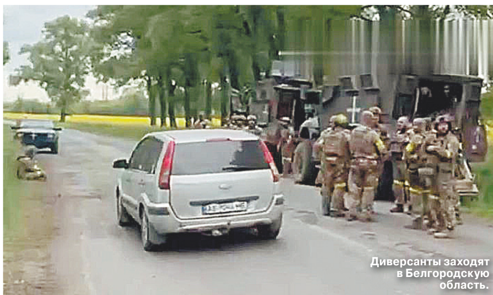
Диверсанты заходят в Белгородскую область.

В Белгородской области было уничтожено более 70 диверсантов