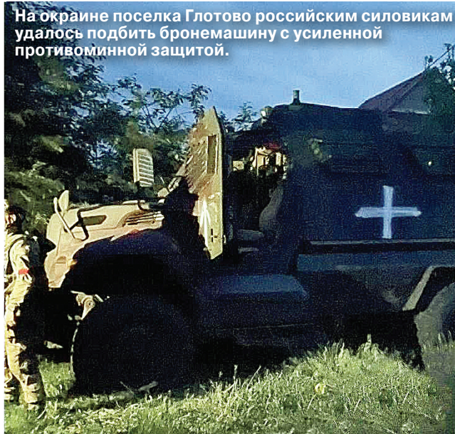
На окраине поселка Глотова российским силовикам удалось подбить бронемашину с усиленной противоминной защитой.