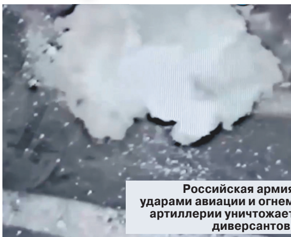
Российская армия ударами авиации и огнем артиллерии уничтожает диверсантов.

Вылазка украинских террористов в Белгородскую область для большинства из них закончилась так, как и должна была закончиться, — смертью, билетом в один конец. На вторые сутки после вторжения боевиков на территорию России Минобороны подытожило свою работу: ликвидировано более 70 украинских террористов, четыре боевые бронированные машины и пять пикапов.