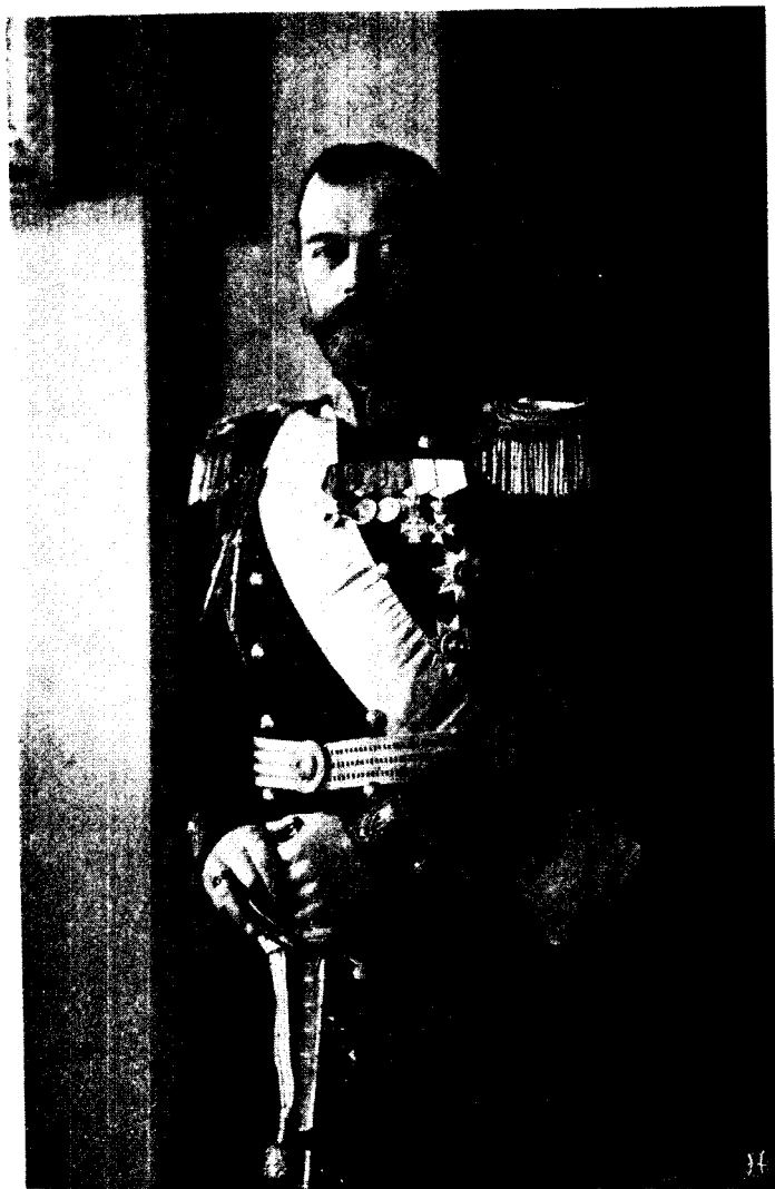
Его Императорское Величество Государь Императоръ НИКОЛАЙ АЛЕКСАНДРОВИЧЪ, Державный Вождь Флота.