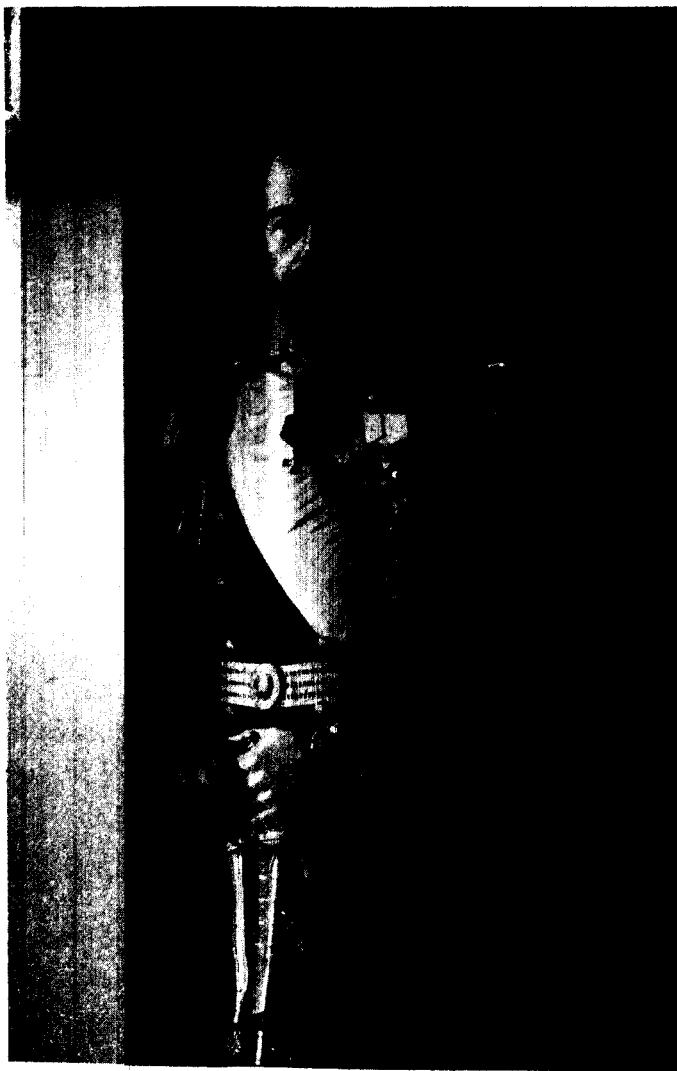
Его Императорское Величество Государь Императоръ НИКОЛАЙ АЛЕКСАНДРОВИЧЪ, Державный Вожьдъ Флота.