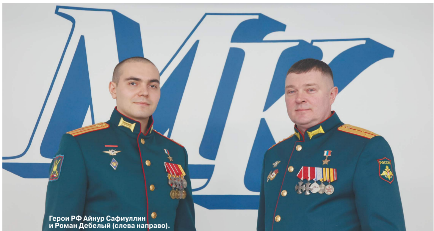
Герои РФ Айнура Сафиуллин и Роман Дебелый (слева направо).

Участники специальной военной операции посетили редакцию «Московского комсомольца» в преддверии Дня защитника Отечества