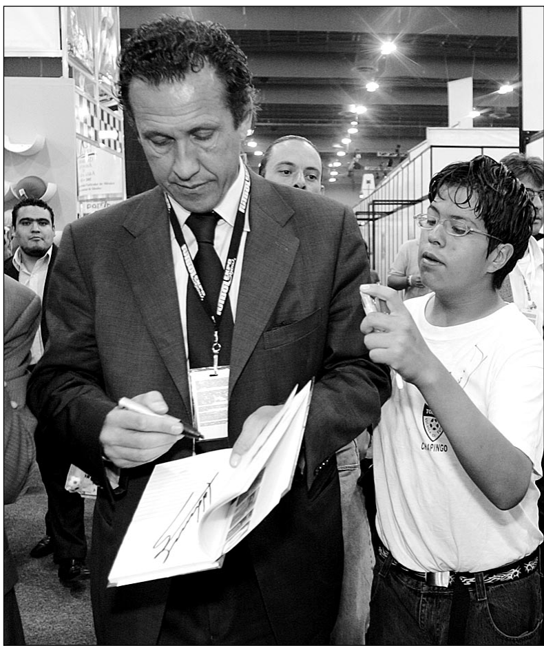
Хорхе ВАЛЬДАНО до сих пор остается кумиром тысяч болельщиков в Аргентине и Испании.

Мне действительно приходилось соперничать с ней в товарищеских матчах. Ох и непросто было, скажу я вам! Сборная СССР была