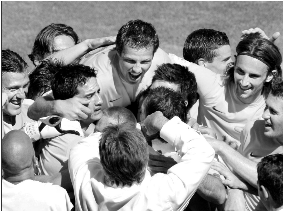
Вчера. Кайзерслаутерн. Австралия - Япония - 3:1. Ликут подопечные Гуса ХИДДИНКА (сам тренер - на первом плане, спиной к нам) - есть первая победа на ЧМ-2006!