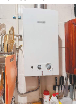
Ядовитый газ не уходил через вентиляцию, а оставался в помещении.

Как позже оказалось, вытяжка газового водонагревателя была неисправна.