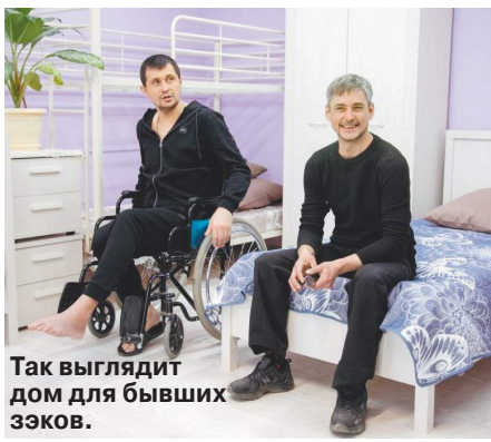
Так выглядит дом для бывших эзэков.