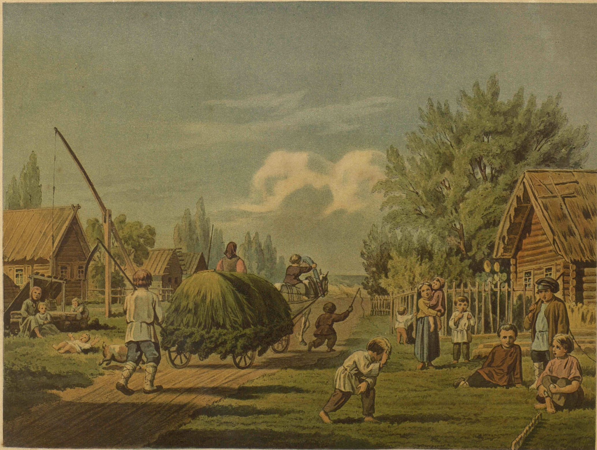
Рис. Гравюра Шерера Навалина № 6. Москва