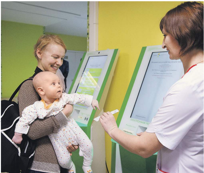
Новый профстандарт поможет врачам лучше лечить малышей

Союз педиатров России разработал профессиональный стандарт для участковых врачей-педиатров. В документе подробно описаны знания и умения, которыми должны обладать эти специалисты. В частности, указано, что детские врачи обязаны находить контакт с ребенком и его родителями и составлять «генеалогическое древо в пределах трех поколений родственников, начиная с больного ребенка». В профессиональном стандарте подробно описаны пять трудовых функций участковых врачей-педиатров: диагностическая, лечебная, реабилитационная, профилактическая и организационная. А в разделе необходимых умений, например, подробно описано, как нужно оценивать состояние и самочувствие ребенка: осмотреть и оценить кожные покровы, выраженность подкожно-жировой клетчатки, ногти, волосы, видимые слизистые, лимфатические узлы, органы и системы организма ребенка, оценить соответствие паспортному возрасту физического и психомоторного развития детей. Председатель исполкома Союза педиатров России,