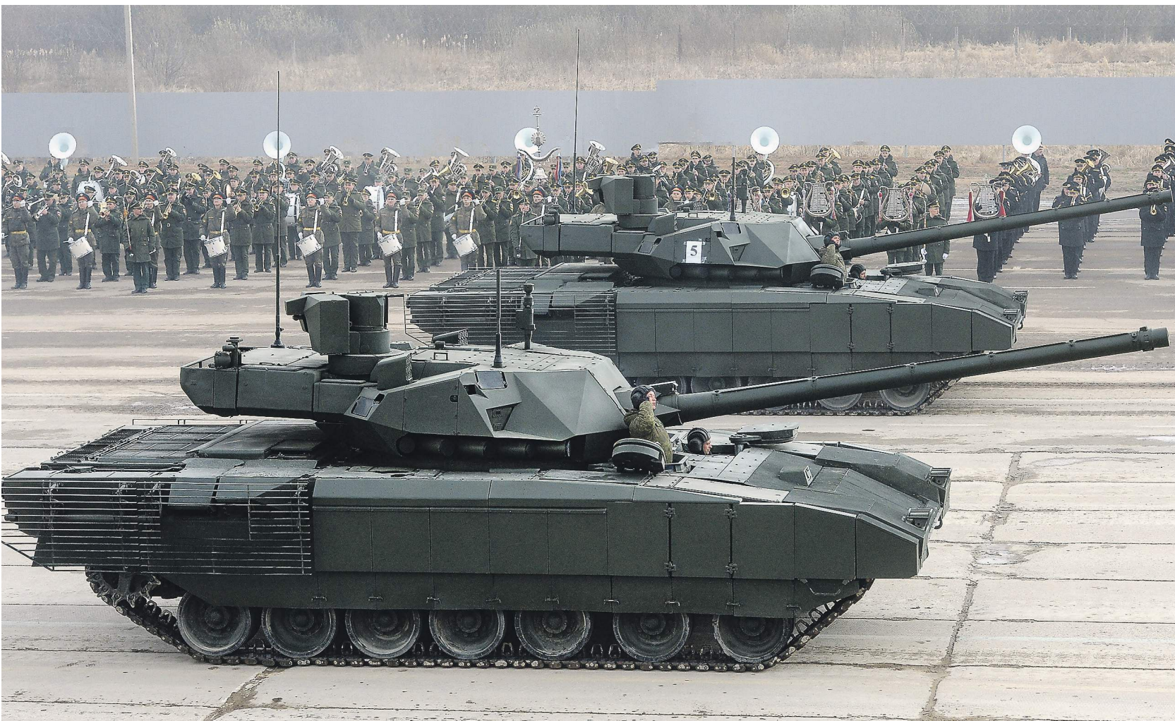
Пластинчатые щиты в разы повысят защищенность «Арматы» и других боевых машин