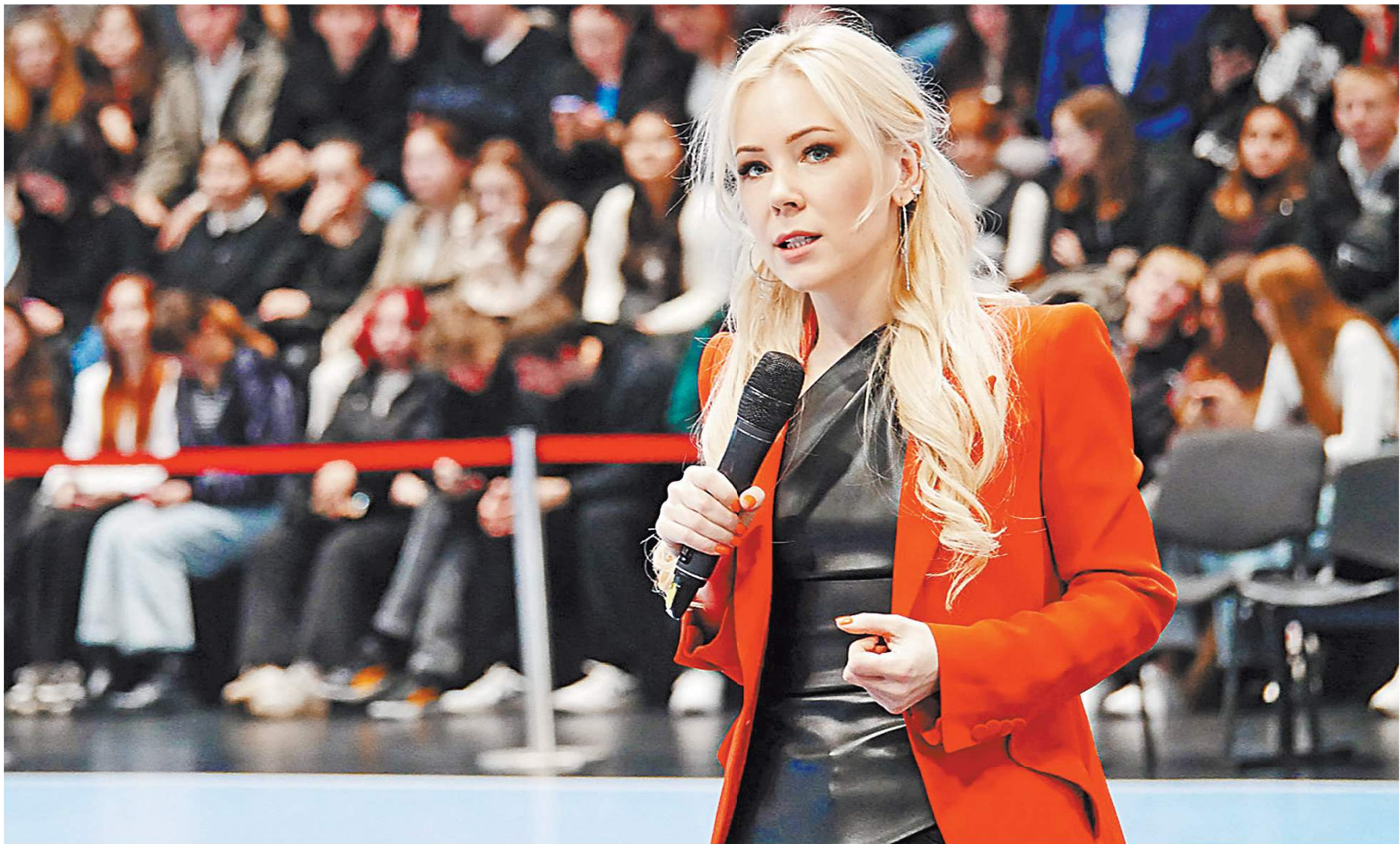
ПРЕСС-СЛУЖБА ЛИГИ БЕЗОПАСНОГО ИНТЕРНЕТА