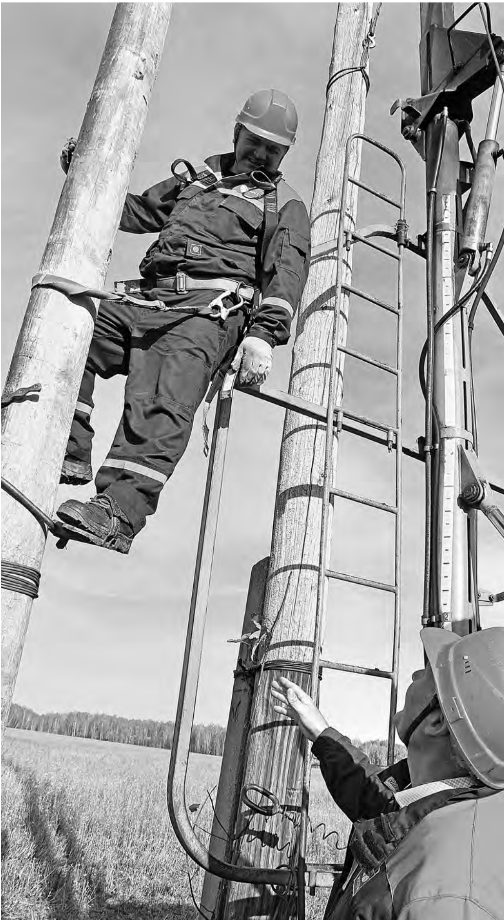
Тариф на передачу электроэнергии для предприятий и учреждений будет различным в зависимости от уровня напряжения.

На высоком напряжении экономия от снижения тарифа ожидается в размере 850 миллионов рублей в год, на среднем и низком—600–650 миллионов. Власти рекомендовали руководителям бизнеса за счет сэкономленных средств повысить зарплаты своим работникам, как будет сделано в бюджетных организациях. ●