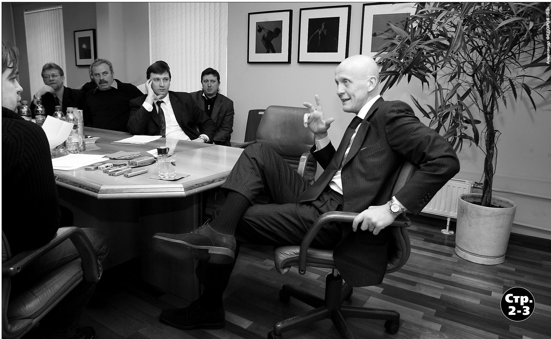
Среда. Москва. Редакция «СЭ». Пьерлуиджи КОЛЛИНА на встрече с журналистами отдела футбола.

В среду в гостях у «СЭ» был самый известный футбольный арбитр мира Пьерлуиджи Коллина. Вчера мы рассказывали, как в новом пресс-центре редакции он вручил лучшим российским судьям – победителям конкурса «Золотая мантия» призы от генерального спонсора и организатора конкурса финансовой группы «ИФД Капиталь», дал пресс-конференцию для российских журналистов. Сегодня – подробности об увлекательной и откровенной беседе Коллины с журналистами отдела футбола «СЭ», которая продолжалась полтора часа.