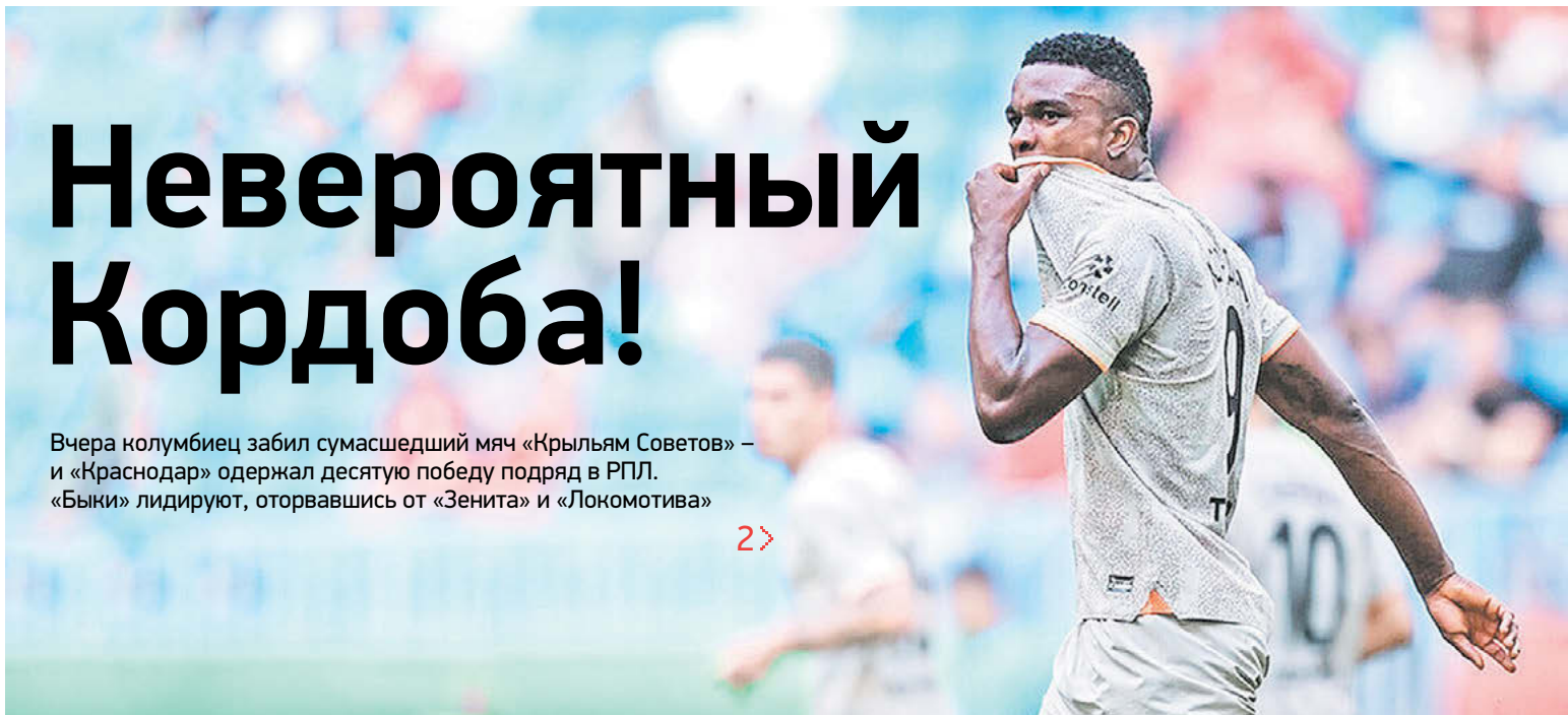
ФК «Крылья Советов»

ФУТБОЛ // Российская премьер-лига. 13-й тур