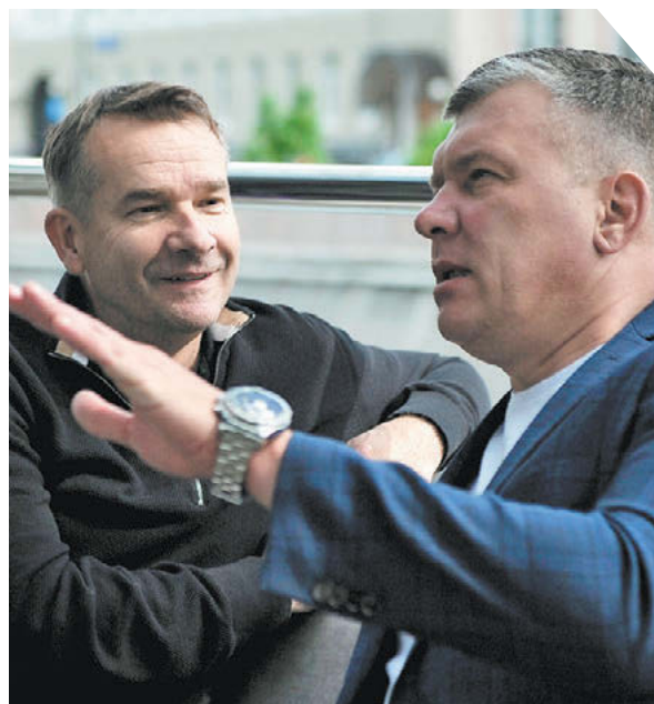
Академия «Спартак» имени Ф. Черенкова

Инсайды «СЭ» о том, как может в ближайшее время измениться красно-белый клуб, где происходит смена генерального директора