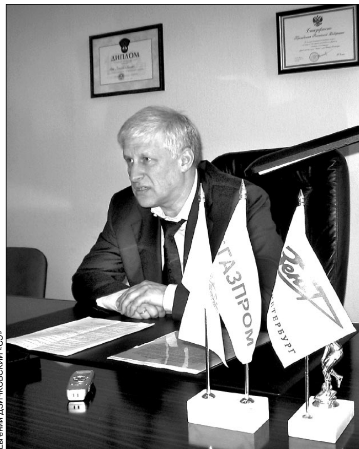
Вчера, Санкт-Петербург. Сергей ФУРСЕНКО.