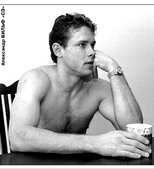
Майами. Павел БУРЕ пока дома в США, но решение уже принято: в случае неудачи «Пантер» он прилетит в Питер.

что до удобных и неудобных... Думаю, так вообще нельзя считать. У каждой команды есть и плюсы и минусы. - Кто обычно опекает вас в «Нью-Джерси»?