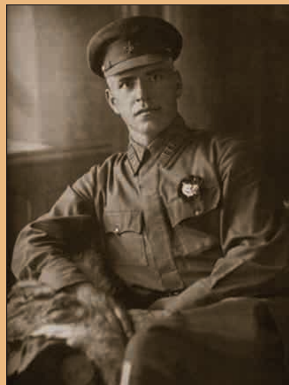
Г.К. Жуков 1930 г.