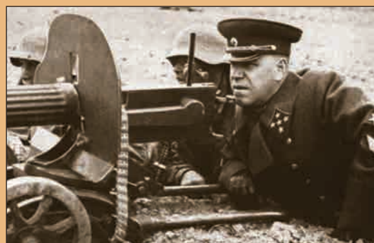
▲ Генерал армии Г.К. Жуков на полевых учениях