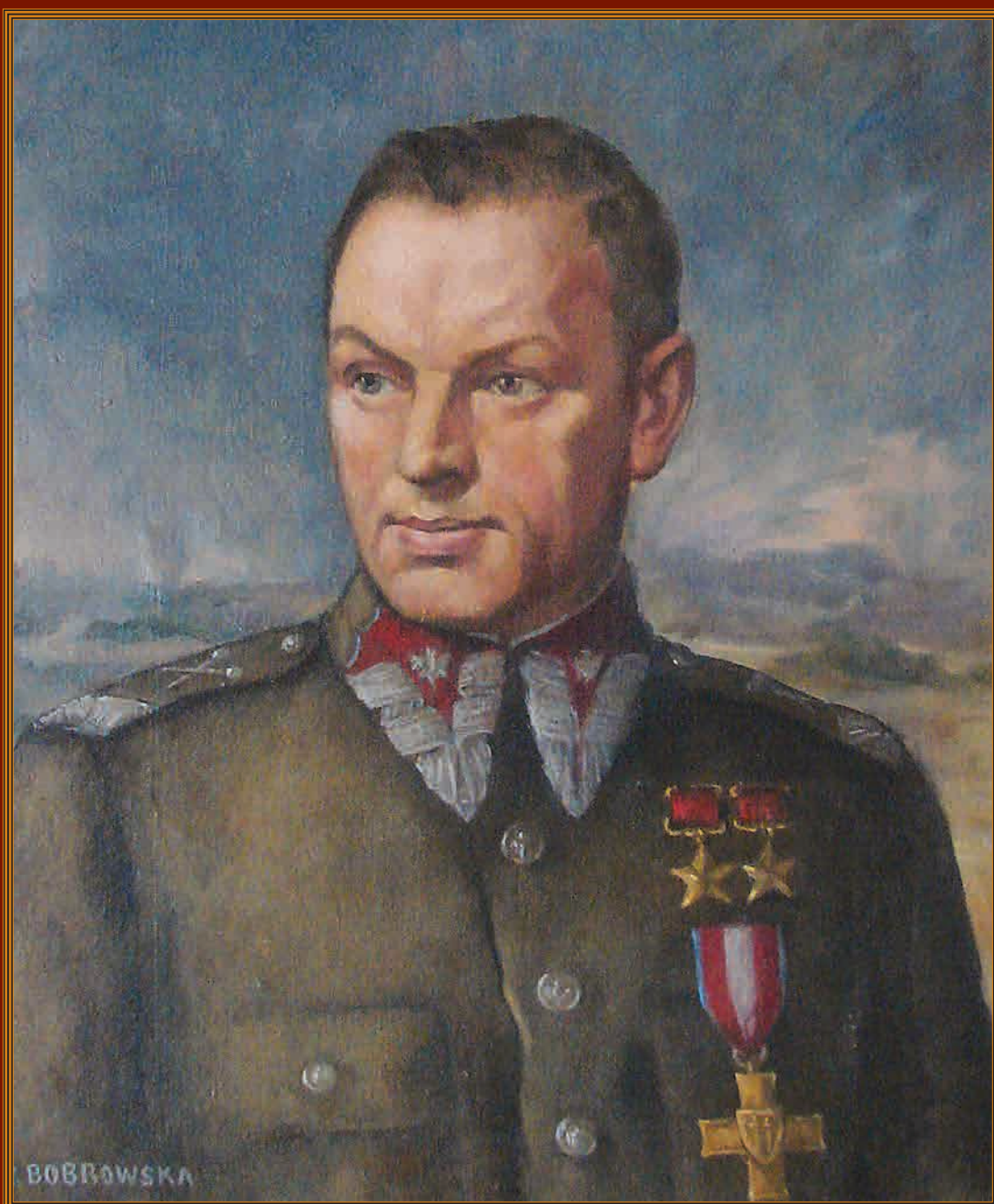
Маршал Польши К.К. Рокоссовский Художник В. Бобровска (Польша)

5 декабря — 70 лет со дня начала контрнаступления советской армии против немецко-фашистских войск в битве под Москвой