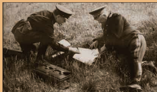
▲ Г.К. Жуков в своём «полевом кабинете»