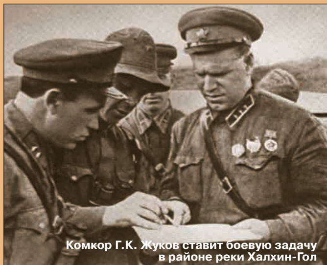
Комкор Г.К. Жуков ставит боевую задачу в районе реки Халхин-Гол