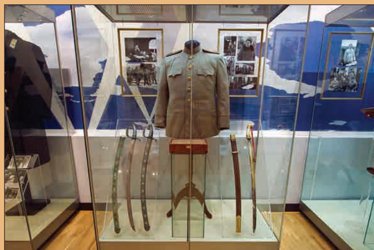
Китель и подарочные сабли Маршала Советского Союза Г.К. Жукова