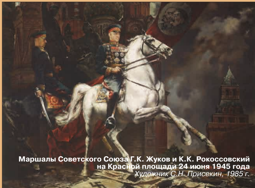
Маршалы Советского Союза Г.К. Жуков и К.К. Рокоссовский на Красной площади 24 июня 1945 года Художник С.Н. Присекин, 1985 г.