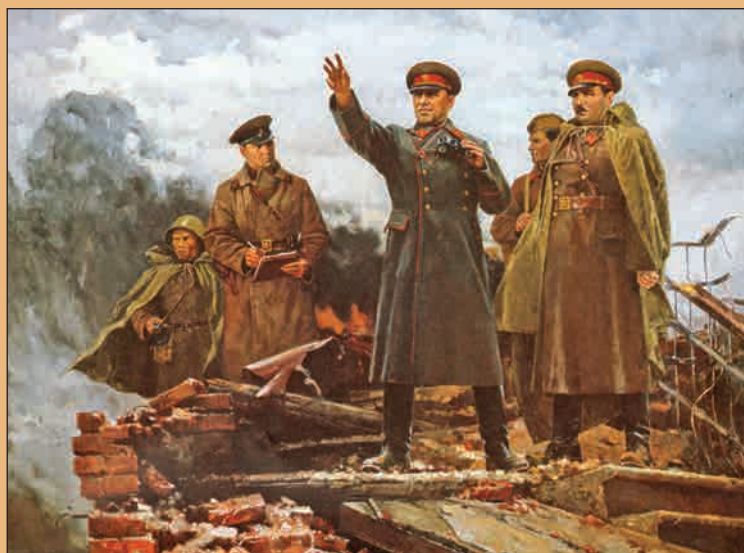
▲ Г.К. Жуков и И.И. Федюнинский на Пулковских высотах Художник А.Н. Семёнов, 1986 г.