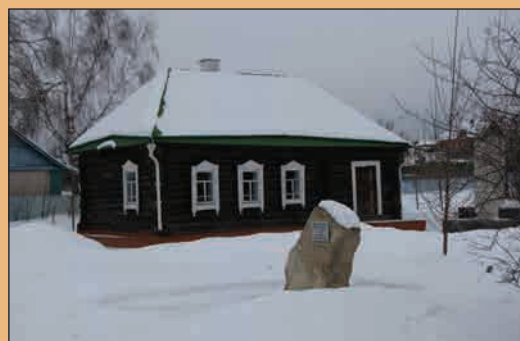
Дом маршала Г.К. Жукова в деревне Стрелковка Калужской губернии