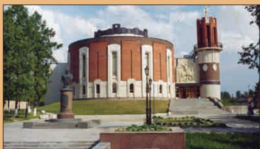
Государственный музей Г.К. Жукова в городе Жуков Калужской области