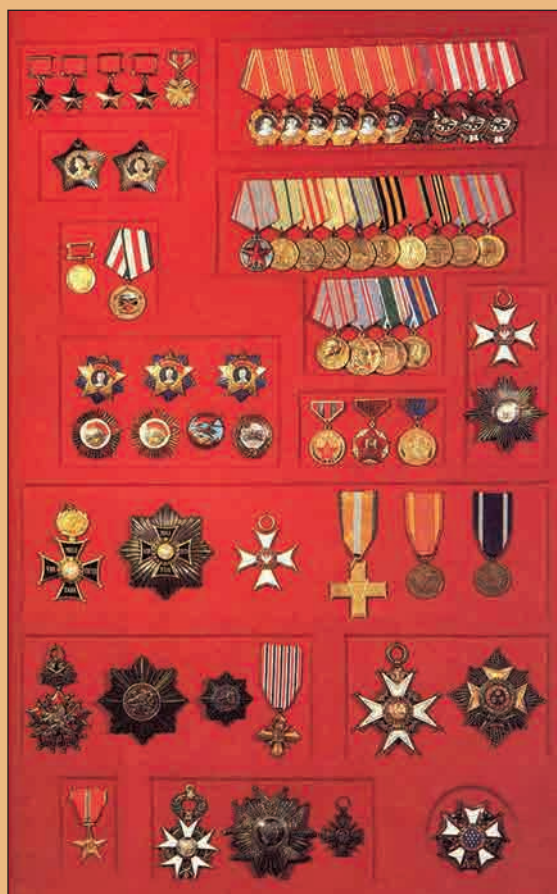
Награды Г.К. Жукова

Похоронен на Красной площади у Кремлёвской стены в Москве.