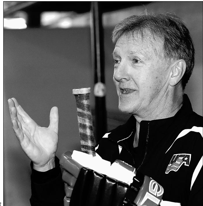
Главный тренер сборной США Рон УИЛСОН.