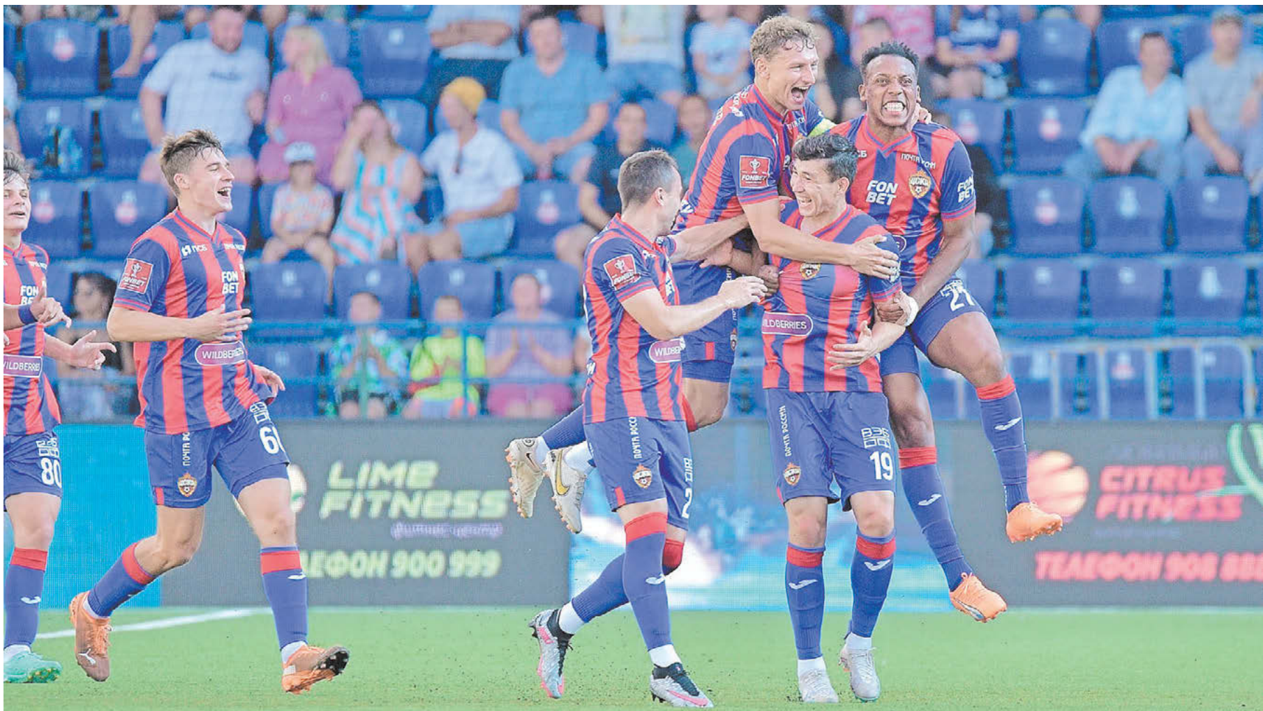
Вчера. Оренбург. «Оренбург» – ЦСКА – 0:6. Радость армейцев

Вчера армейцы разгромили «Оренбург» в Кубке России. Средний возраст стартового состава красно-синих – 23 года