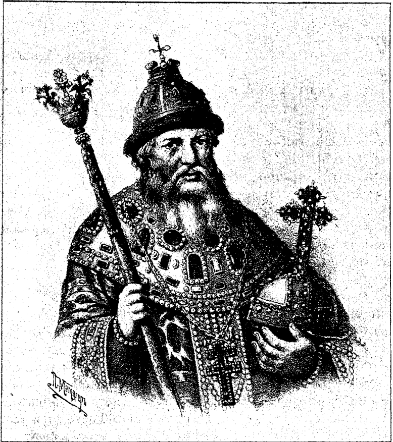
Царь Алексѣй Михайловичъ.

Но вотъ неожиданно-негаданно страшась лихая бѣда надъ