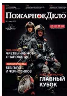
На обложке номера – защитная экипировка для пожарных и спасателей производства ГК «Энергоконтракт» Дизайн – Ирина Томозова