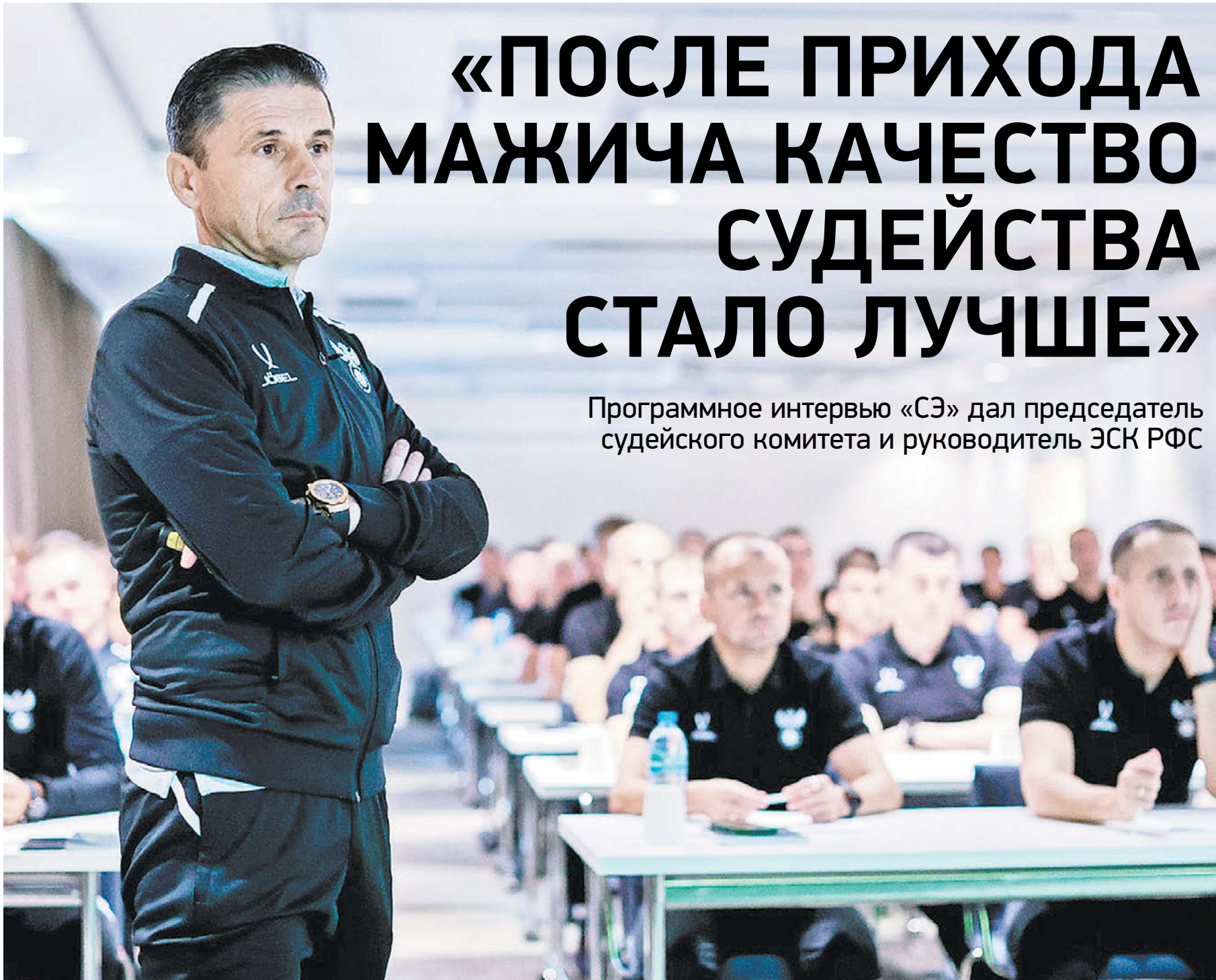
Руководитель департамента судейства и инспектирования РФС Милорад Мажич

Программное интервью «СЭ» дал председатель судейского комитета и руководитель ЭСК РФС