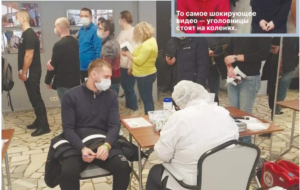
То самое шокирующее видео — уголовники стоят на коленях.

Откровения уволенного за издевательства над осужденными начальника исправительного центра ФСИН