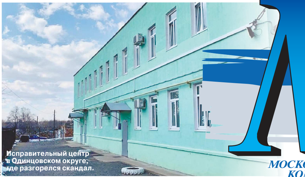
Исправительный центр в Одинцовском округе, где разгорелся скандал.