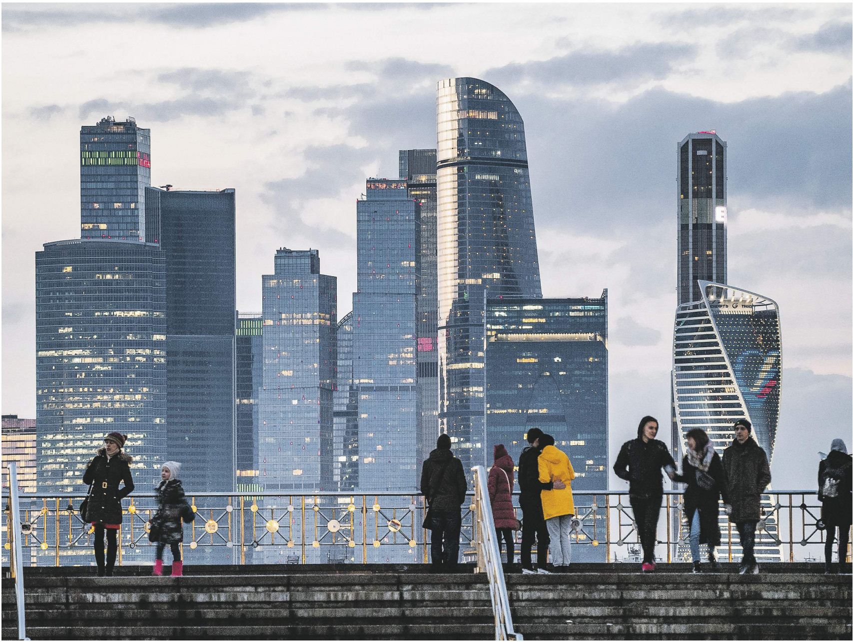
Константин Кошкин / Иллюстрация

Большинству регионов России удалось сохранить свои позиции в рейтинге, но есть и заметное улучшение показателей.