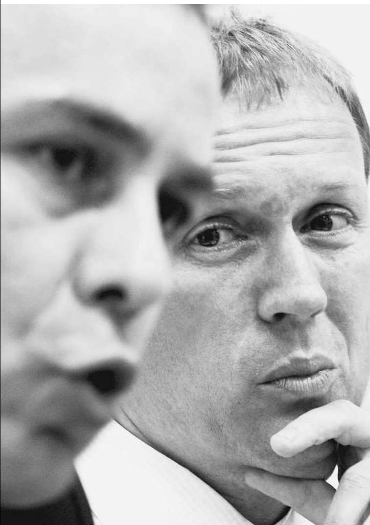
Дмитрий Ковтун и Андрей Луговой

— Прежде чем отвечать, хочу заметить, что все эти месяцы публикации в английской прессе носили односторонний и некорректный характер, — начал он. → стр. 3