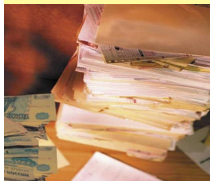
Заплати налоги и спи спокойно