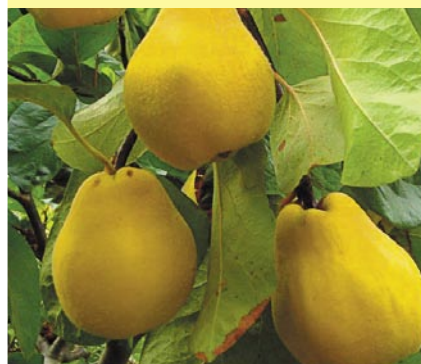
Типовые правила страхования урожая многолетних насаждений с государственной поддержкой