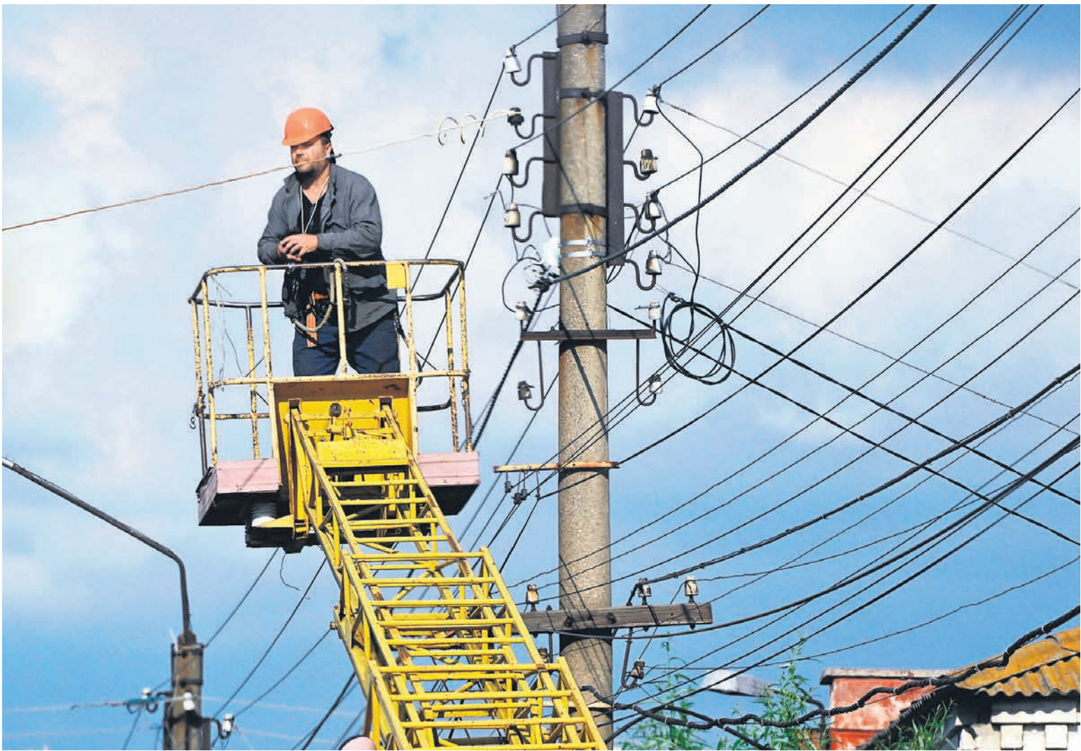
В «Россетях» полагают, что граждане необоснованно мало платят за подключение к электросетям и с этим пора что-то делать

● ТП выполняется для первого присоединения энергетических установок потребителей к электросетям или расширения мощностей. Долгие годы в РФ платежи за технологическое присоединение для населения удерживались на уровне 550 руб. за 15 кВт. С 1 июля 2022 года правительство ввело минимальный и максимальный размеры платы за 1 кВт, для льготных категорий граждан действует сниженная ставка. Устанавливают плату за подключение региональные власти. Размер платежа также за-