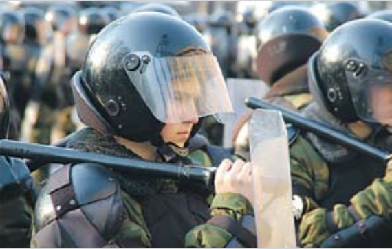
По сообщениям корреспондентов «ВПК», информативности АРМС-ТАСС и Интерфакс-АВН

От Внутренних войск в учениях были задействованы более 8 тысяч военнослужащих и около 400 единиц боевой и автомобильной техники. От ор-ганов внутренних дел — около 2 тысяч человек и 50 единиц техники, от других силовых структур — около 3 тысяч человек и около 150 единиц техники. К тренировке привле-кались 130 органов управления от различных министерств и ведомств, более 50 воинских частей и подразделений по охране важных государствен-ных объектов, 27 воинских частей и подразделений из состава резерва сил и средств Федерального оперативного штаба и оперативных штабов в субъектах РФ.