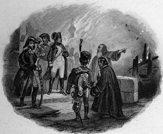
Incendie de Moscou.