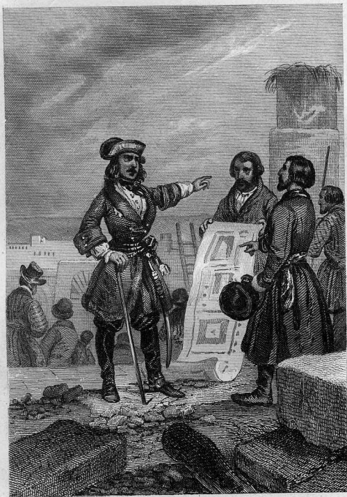
Pierre-le-Grand dirigeant lui-même le plan de St. Petersbourg.