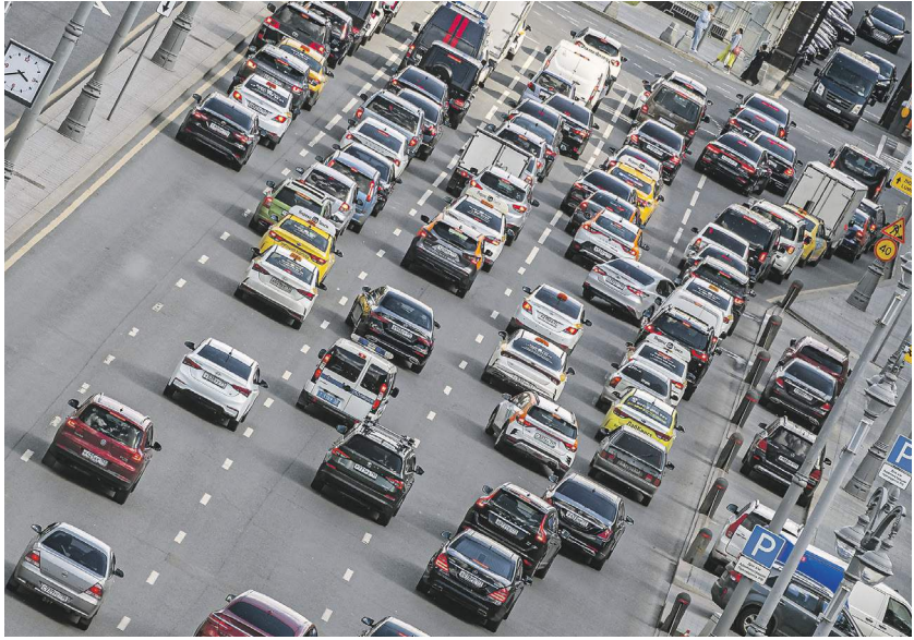
Константин Косилов / Известия