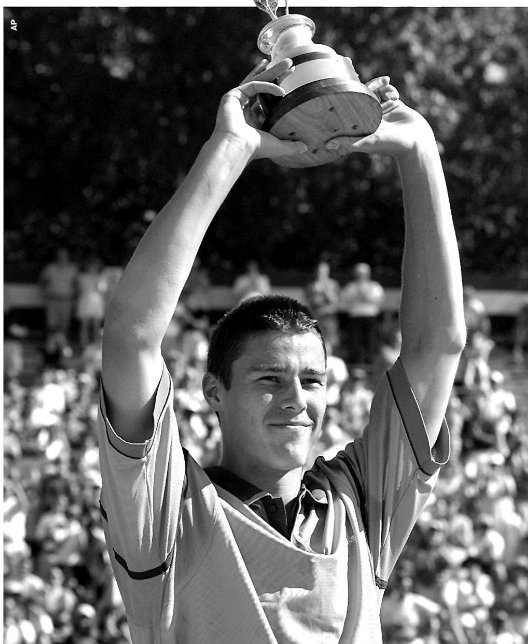
Воскресенье. Бостон. Марат САФИН со своим первым чемпионским трофеем на турнирах ATP Tour.

В воскресенье в Бостоне в финале турнира MFS Pro Championships россиянин Марат Сафин со счетом 6:4, 7:6 (13:11) победил 9-ю ракетку мира англичанина Грегга Руседски