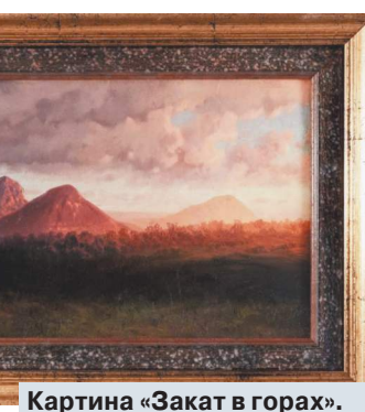
Картина «Закат в горах».

Галерист связался со знакомым арт-дилером, 62-летним уроженцем Азербайджана, а тот вскоре сообщил, что на предметы роскоши нашлись покупатели. В начале декабря руководитель галереи срочно вылетел из Москвы в Самару, чтобы забрать у собственника украшения. 3 декабря помощница галериста встретилась с арт-дилером и передала ему под расписку картину. А через два дня прителевший в стоимость с драгоценностями