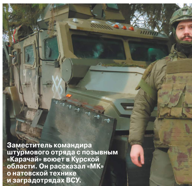
Заместитель командира штурмового отряда с позывным «Карачай» воюет в Курской области. Он рассказал «МК» о натовской технике и заградотрядах ВСУ.