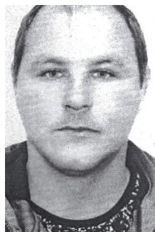
Всех, у кого есть информация о совершенных подозреваемым преступлениях, просьба сообщить по телефону 8(496)422-35-76.

Еще в 2020 году фамилию мужичины «склоняли» в чатах Орехова-Зуева, но совсем по другой причине. Уроженца Брянска упрекали в том, что он мухлюет при реализации товаров через Интернет. А в 2021 году он в очередной раз отправился в тюрьму на 2,5 года по приговору Орехово-Зуевского суда: