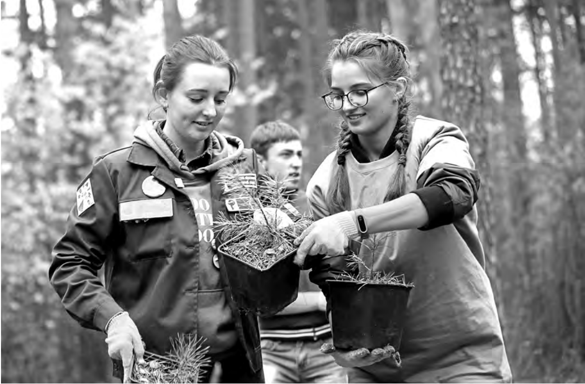
Пять тысяч саженцев деревьев, в том числе сосны, высадили на двух гектарах Шарташского лесопарка участники состоявшегося в Екатеринбурге чемпионата России среди вальщиков леса. Лесорубы позвали себе на помощь волонтеров.