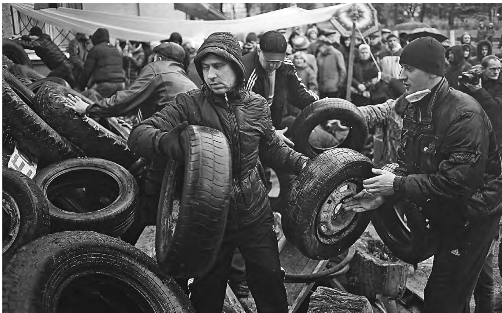
Жители юго-восточных городов Украины от слов перешли к делу — борьбе за свои законные права.