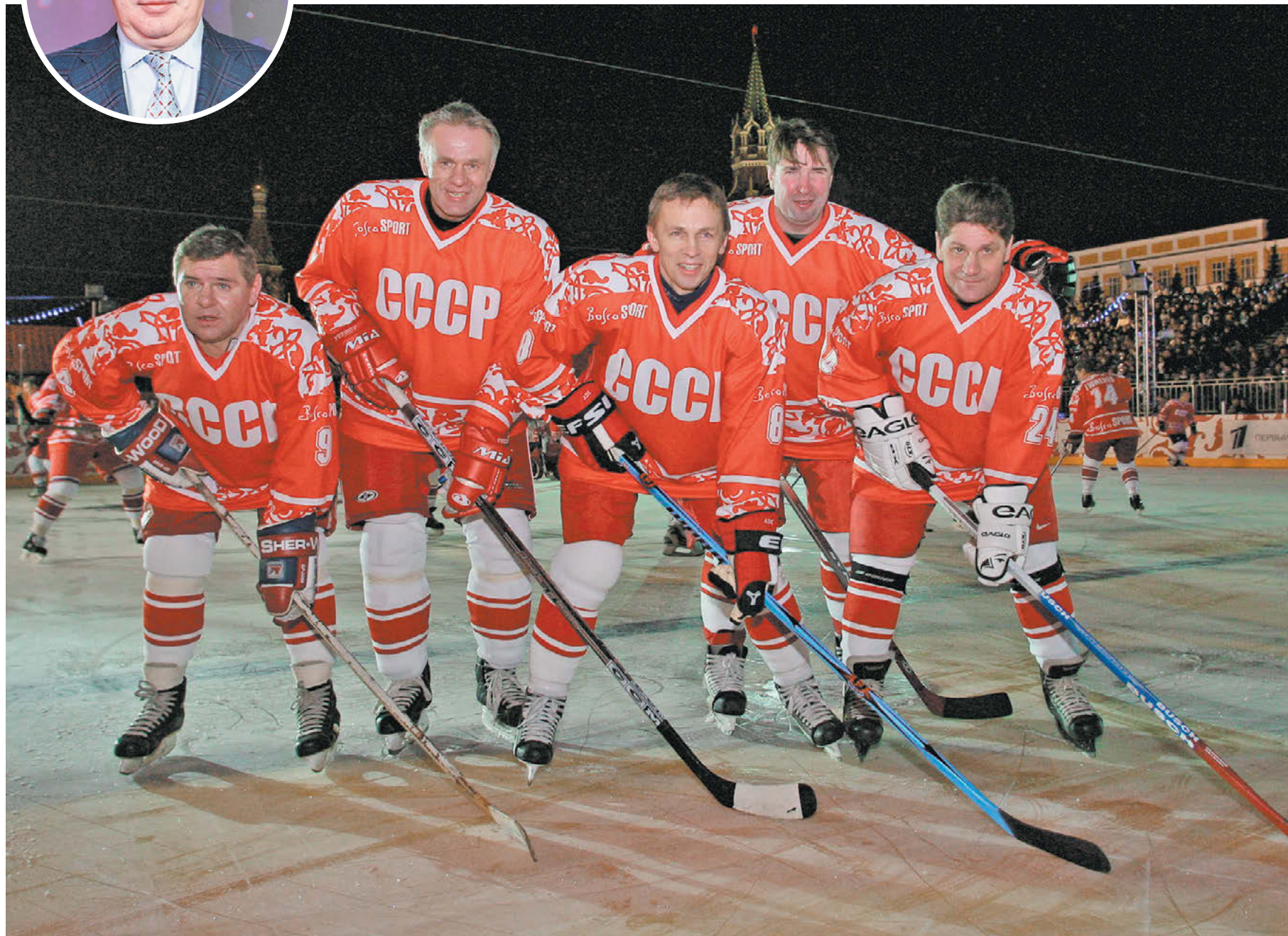
9 декабря 2006 года. Москва. Сборная СССР – сборная мира – 10:10. Владимир Крутов, Вячеслав Фетисов, Игорь Ларионов, Алексей Касатонов и Сергей Макаров (слева направо)

Вторая часть откровенного интервью звезды мирового хоккея, двукратного (1984, 1988) олимпийского чемпиона, которому 14 октября исполнилось 65 лет