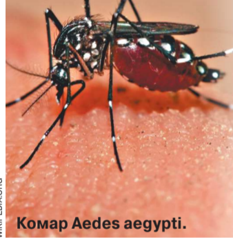
Комар Aedes aegypti.