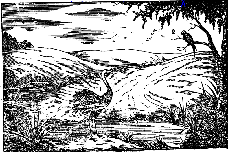
А. а. Аистъ.