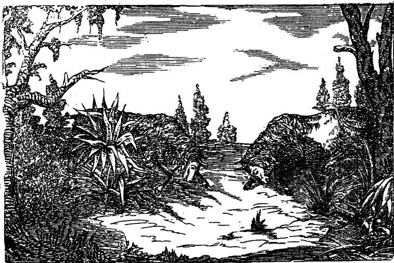
Б. 6. Бизоны.