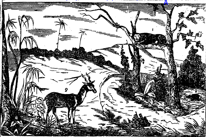
Д. д. Дикая кошка и серна.